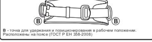
Рис. 2. Типы крепежных точек

ООО «Вентпро» оставляет за собой право внесения незначительных изменений в конструкцию своей продукции, не влекущих снижения потребительских свойств.